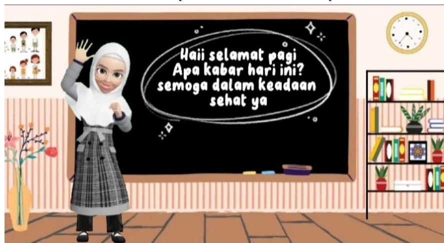
Gambar 2. Tampilan Pendahuluan