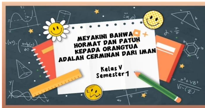
Gambar 1. Tampilan Awal Video Berupa Cover

Storyboard atau papan cerita yaitu uraian penjelasan program yang dikembangkan. Storyboard berisi visual dan audio penjelasan masing – masing alur dalam Flowchart .